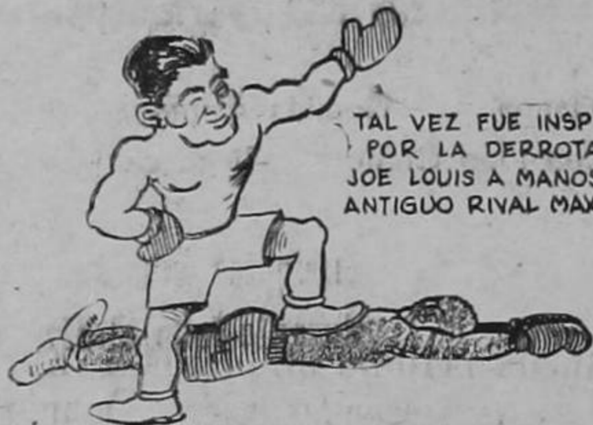
TAL VEZ FUE INSPIRADO POR LA DERROTA DE JOE LOUIS A MANOS DE SU ANTIGUO RIVAL MAX SCHMELING